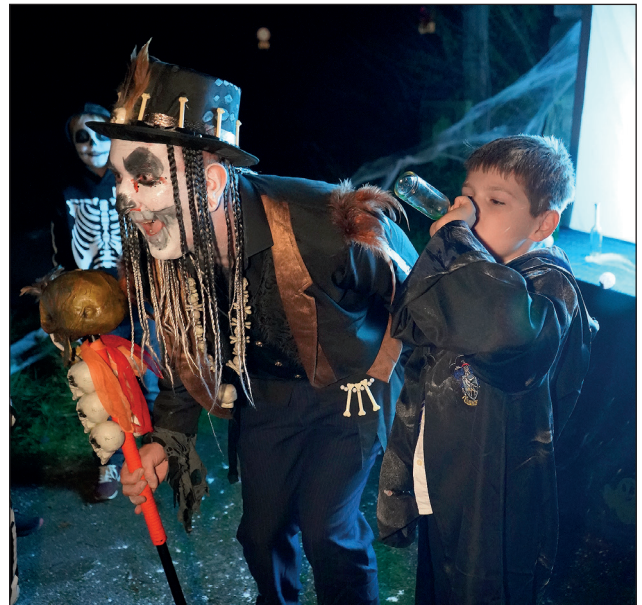
Auf dem Weg zu den einzelnen Stationen, an denen es Rätsel zu lösen und Aufgaben zu erfüllen gab, warteten gruselige Gestalten auf die Kinder.