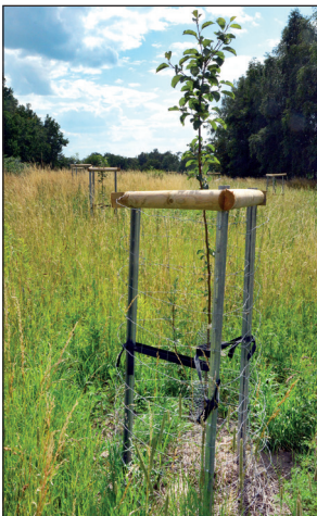
Zwei erste Klassen des Chemnitzer Schulmodells pflanzten im Rahmen des Projektes „We Parapom“ auf den Flächen des BUND in Hilbersdorf bereits 50 Apfelbäume.