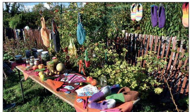
Auf einer Fläche von 750 Quadratmetern Gartenland im Kleingartenverein Reichsbahn-Wohlfahrt e.V. in Ebersdorf bringen die Salute-Frauen Obst und Gemüse von der Aussaat bis zur Ernte.