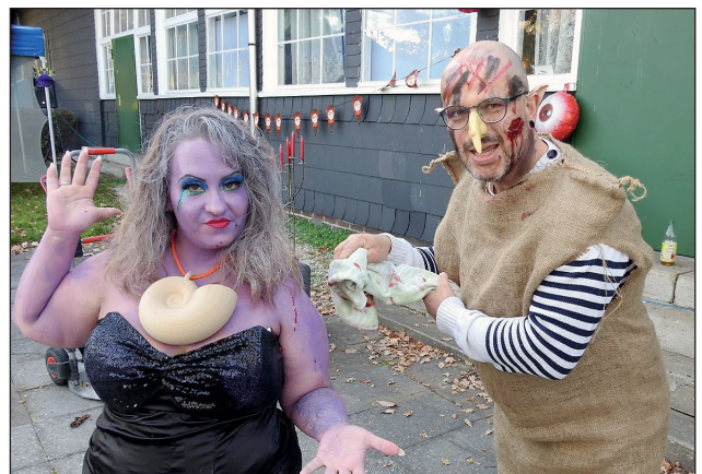
Am Ende gab es für alle Beteiligten Kinder, Darsteller, Aufsichtspersonen und Eltern eine lustige Feier mit Preisverleihung für den schönsten Kürbis.