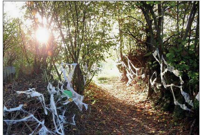
Auch im letzten Jahr fand der Grusel Event rund um das Gelände des Schauspielplatz Eisenbahn statt. Viel Zeit und Arbeit steckten die Organisatoren in die Deko.