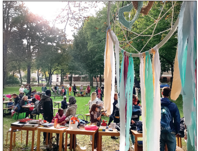
Schon im letzten Jahr ein voller Erfolg: Der Tausch-, Tratsch- und Trödeltreff am Schillerpark.